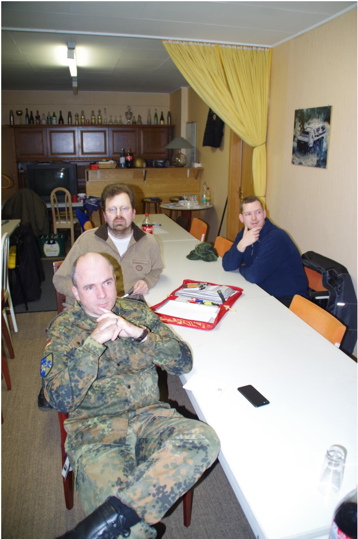
Aufmerksame Zuhörer.