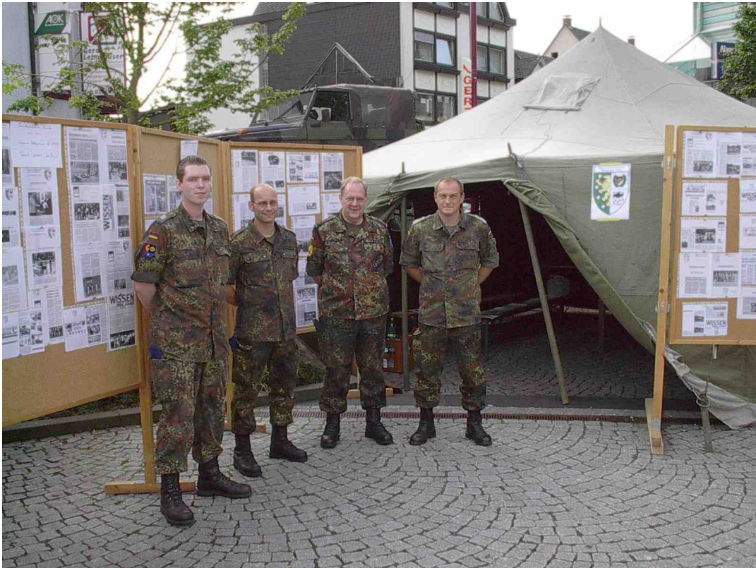
Wissener Reservisten informierten in Westerborg über ihre vielschichtigen Aktivitäten.